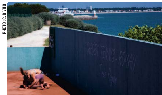
Danse contemporaine au Garden Club Tennis