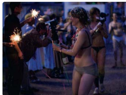
Façon télé-réalité, une création de Gob Squad pour Royan, au gymnase Landry