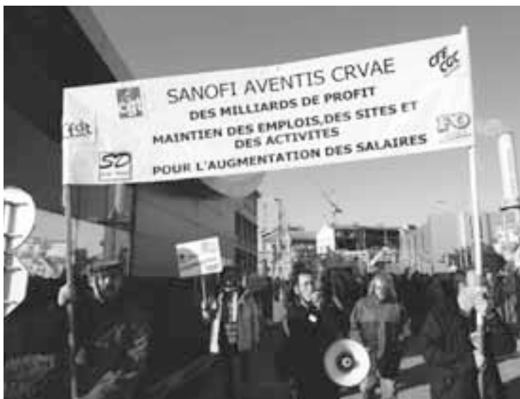
Manifestation pour le maintien de l'emploi chez Sanofi-Aventis, le 11 décembre dernier, à Vitry-sur-Seine.

La ligne A du RER, la plus importante ligne de transport en commun d'Ile-de-France, quasiment paralysée, jeudi 17 décembre, au huitième jour d'une grève de ses 550 conducteurs. Ils réclament, entre autres, une augmentation de plus de 10 % de leur prime mensuelle de conduite (630 euros). Et le mouvement s'est élargi à l'ensemble du réseau RER, aux bus, aux métros, aux tramways... Le personnel de Sanofi-Aventis mobilisé, dans 15 sites sur 48, pour obtenir des augmentations générales de salaire plus fortes que les 1,2 % proposés par la direction, du jamais vu depuis cinq ans dans ce groupe pharmaceutique qui a prévu de sup-