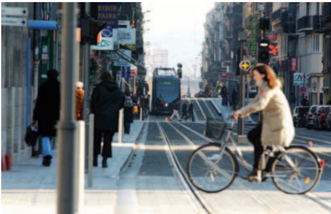
Les habitants de l'agglomération passent aujourd'hui 67 mn à se déplacer par jour contre 62 mn en 1998

■ Parce que ces dernières années, la Cub a mis l'accent sur le développement du réseau de transports et l'amélioration des déplacements et que ses efforts vont se poursuivre sur 2010-2014 avec des investissements de 685 M€, on comprend que la Cub attende beaucoup des résultats de l'enquête Ménages Déplacements (EMD). Cette enquête diligentée par la Cub, les services de l'Etat, le conseil général et la CCIB a été conduite auprès de 6 000 ménages entre novembre 2008 et mai 2009. Elle prend en compte les déplacements des habitants des 27 communes de la Cub et des 69 communes limitrophes. Véritable mine d'informations, l'EMD doit aider à la construction d'une politique globale des transports et des déplacements pour les prochaines années. Mais à la lumière des premiers éléments de synthèse (il faudra une année pour analyser l'ensemble des données : ndlr), il apparaît que le constat est mitigé. «L'agglomération bordelaise est revenue dans la part nationale et n'accuse plus de retard mais nous enregistrons une déception relative par rapport aux objectifs que l'on s'était fixés», reconnaît Vincent Feltesse, le président de la Cub. En effet, en dépit des investissements mobilisés par la Cub, l'enquête ne montre pas de véritable inversion de tendance. «Les transports en commun urbains sont passés de 9 à