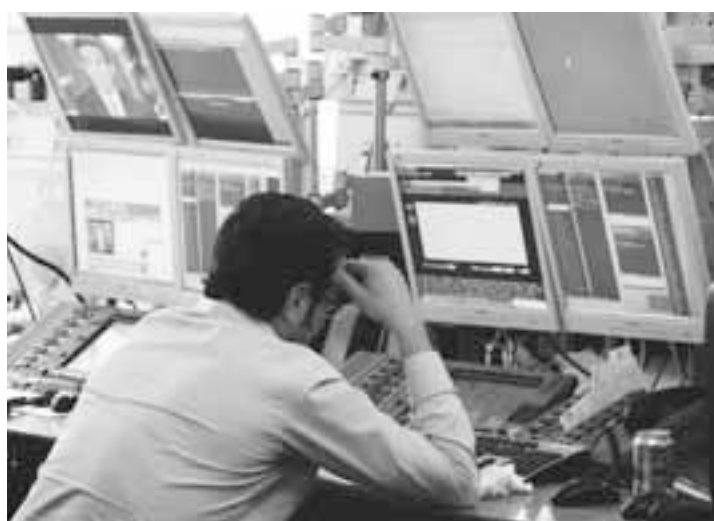
Certains secteurs s'en tirent mieux que d'autres, comme les services, par opposition à l'industrie et à la construction.

Comme l'ont montré les enquêtes de conjoncture publiées ces dernières semaines, le climat des affaires n'est pas terrible. Certains secteurs s'en tirent mieux que d'autres : les