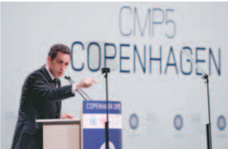
Nicolas Sarkozy, hier, lors de son discours au Bella Center de Copenhague.

Le doute planait hier sur l'issue de la conférence de Copenhague sur le climat, qui doit s'achever ce soir. Arrivés sur place, les chefs d'Etat devaient tenter de s'entendre sur un texte commun.